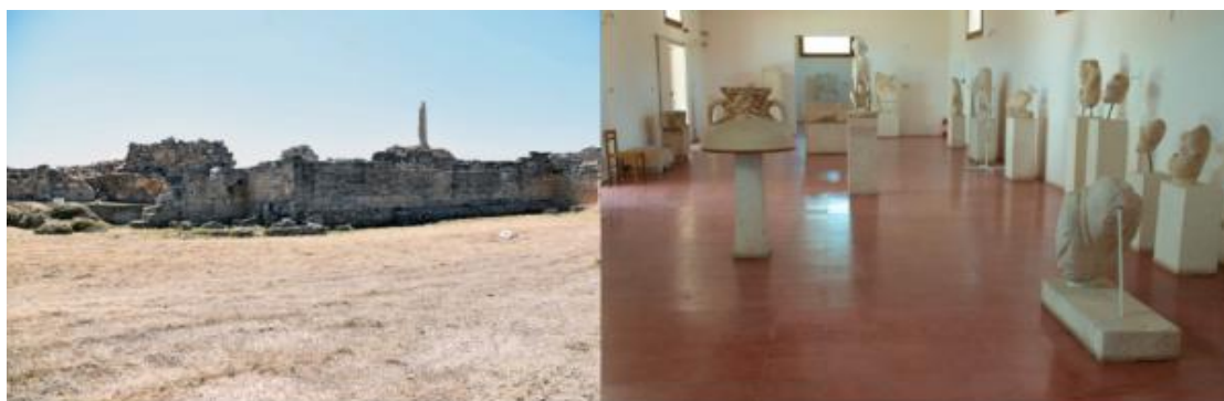
6. 阿法埃娅神庙、阿波罗神庙