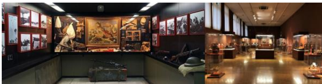
4. 希腊国家考古博物馆