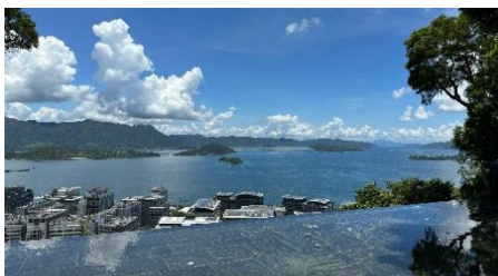
参访交流：香港中文大学